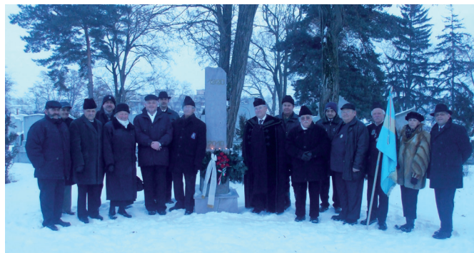
Hősök napja 2012. 05. 27