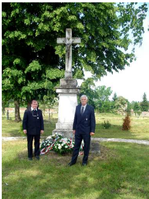
Megemlékezés a balassagyarmati katonatemetőben