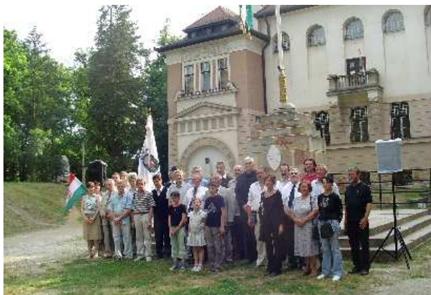
A Nógrád megyei vitézek emlékezése az Ipoly menti országzászló előtt