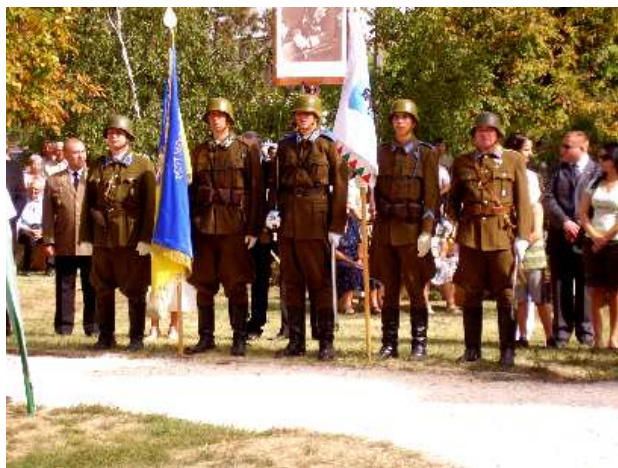
A Vitézi Rend küldöttsége korhű egyenruhában tisztelgett a megemlékezésen.

vitéz nagybányai Horthy Miklós Kormányzó újrátemetésének 15. évfordulója