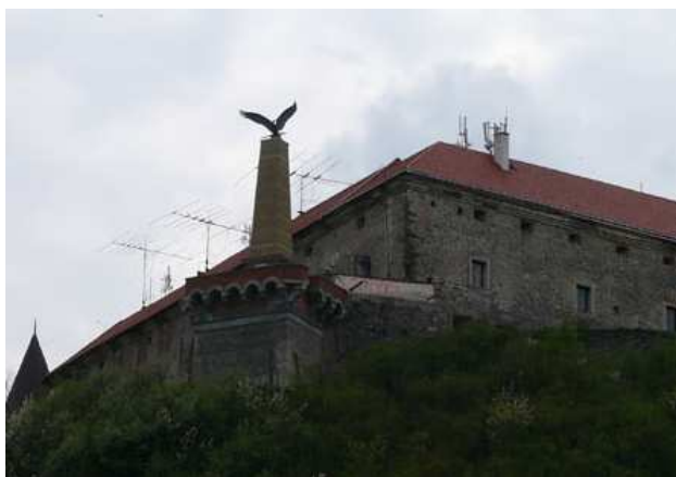
Az emlékmű látképe