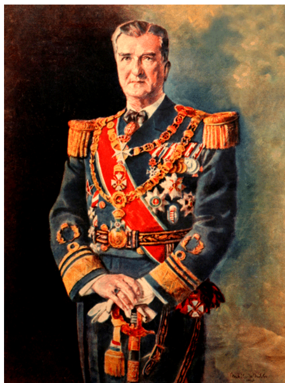
vitéz nagybányai Horthy Miklós Kormányzó