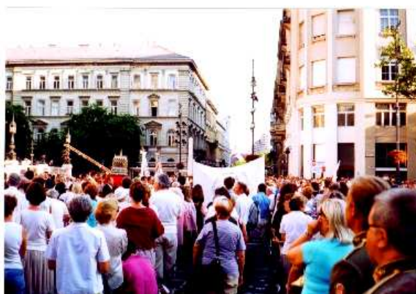
A Szent Jobbot követő menet