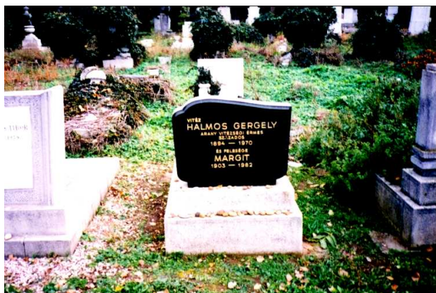
valamint v. Halmos Gergely Arany Vitéségi Érmes százados sírjánál a bicskei temetőben