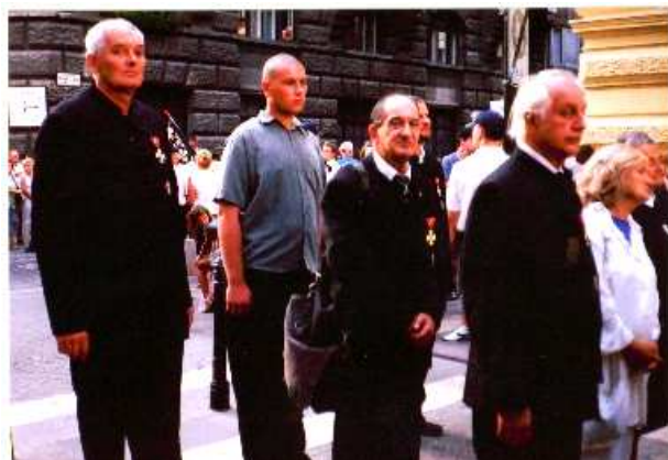
A Rend tisztségviselői a körmeneten.